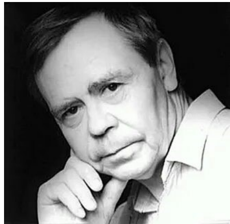
Валентин Григорьевич Распутин –

известный русский писатель и активный общественный деятель.